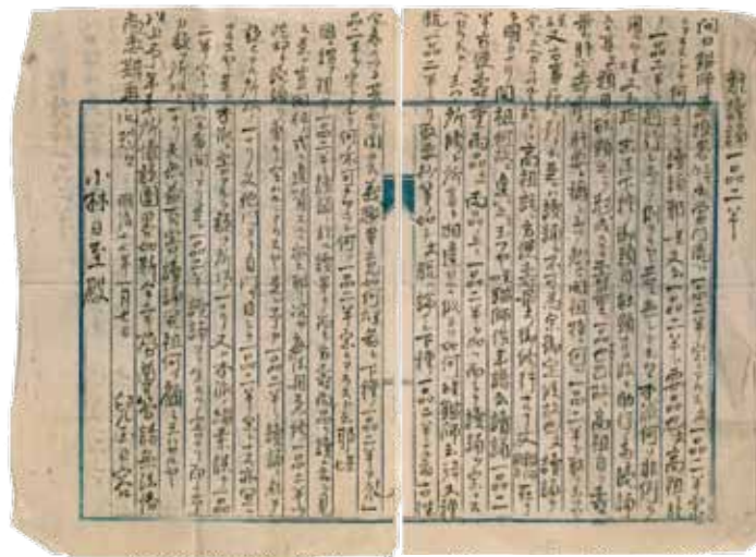
児玉日容上人直筆文