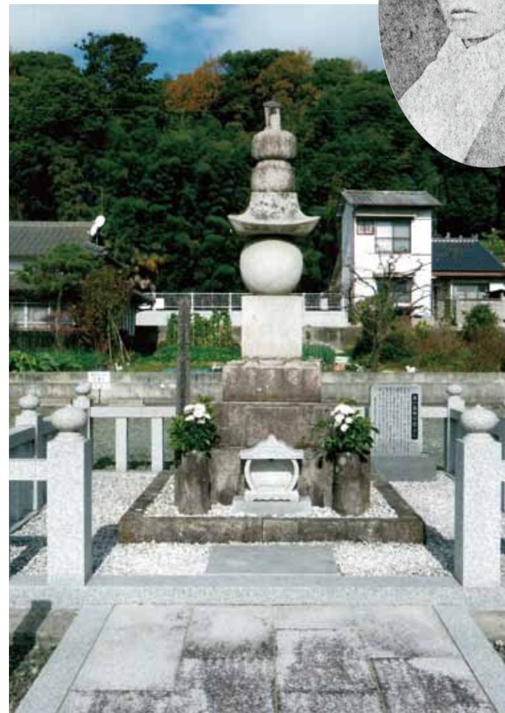
兄玉日容上人墓碑