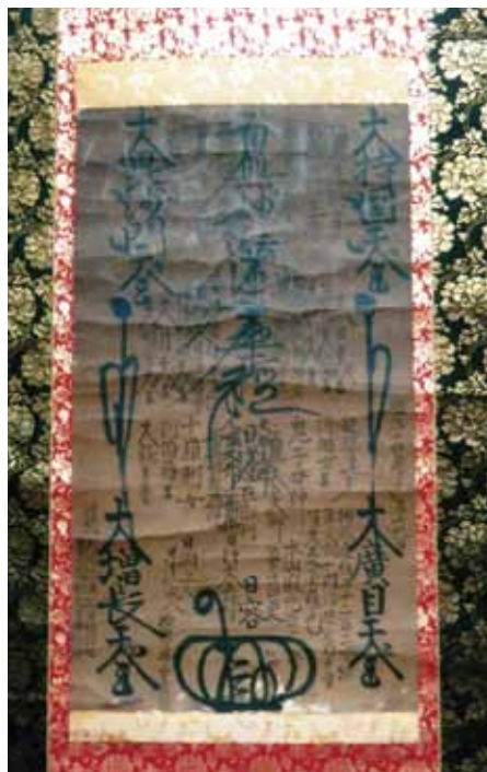
兄玉日容上人直筆大曼荼羅 (井上家所蔵)