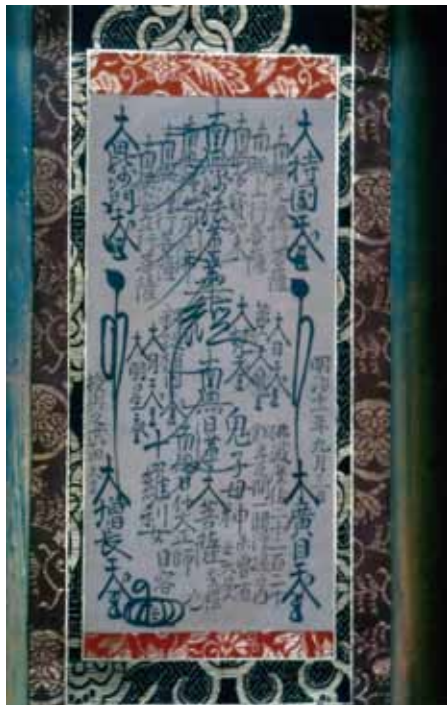
兄玉日容上人直筆大曼荼羅 (武田家所蔵)