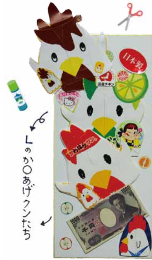
「の」か〇あげクンたち