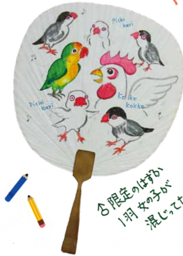
♂限定のはずか 1羽女の子が 混じってた!!