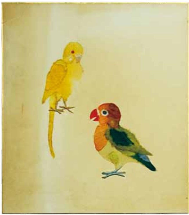
昔作ったちぎり絵 玉三郎(タマちゃん)と 先代の松五郎改メ松子子 (マツちゃん) ♂とってたのに:(卵)うんだの!!